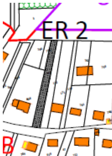
Emplacement réservé n°1= Création d'une voirie -644 m 2 -Commune